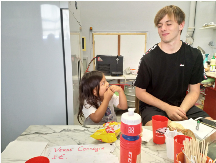
La buvette au taquet !