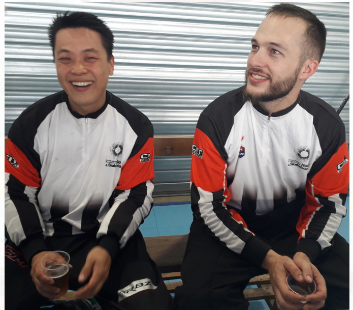
Des arbitres de compét !