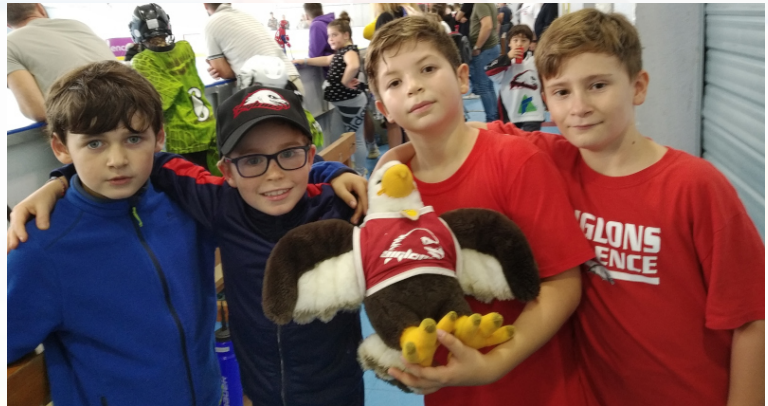
Slappy à domicile