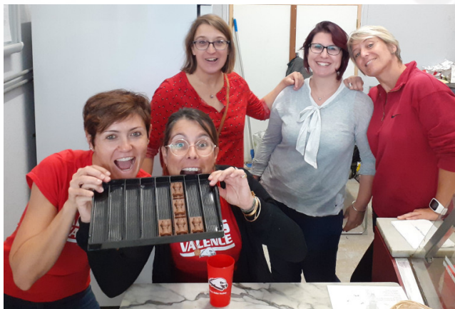
Les mamans à la buvette