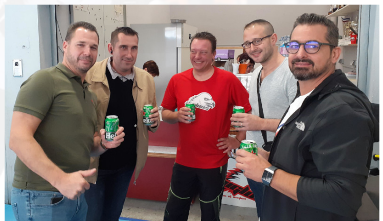
Les papas à la buvette