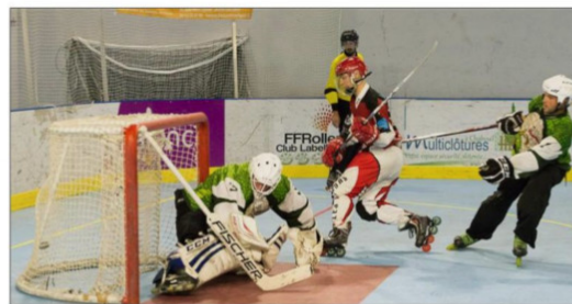
Les Aiglons ont mis à dure épreuve les nerfs du gardien adverse en inscrivant 13 buts.

L'équipe des Alligators évoluait au niveau régional la saison dernière, 2 e du championnat, elle a perdu en play-off et a été cependant repêchée car deux équipes devaient monter en N3. Mais apparemment la marche est très haute