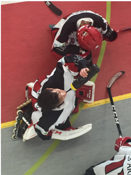
U17 dessus dessous