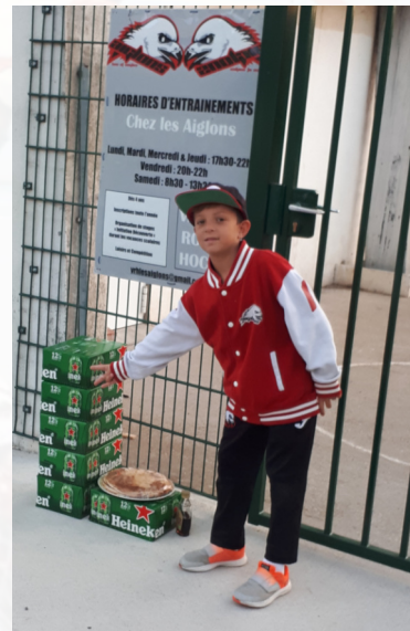
Prêt pour le tournoi des U13 à la maison