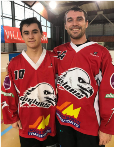
Premier match père et fils!