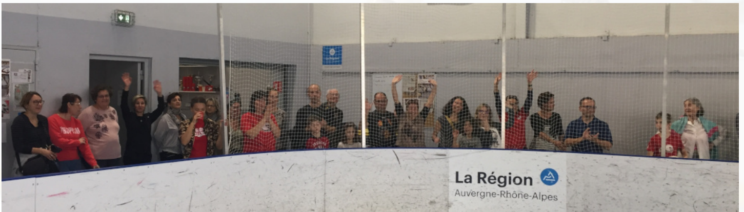
Virage des ultras U17