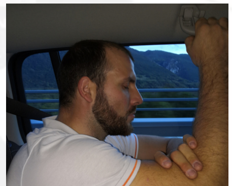
Concentration d'après match ou physique un peu juste ?