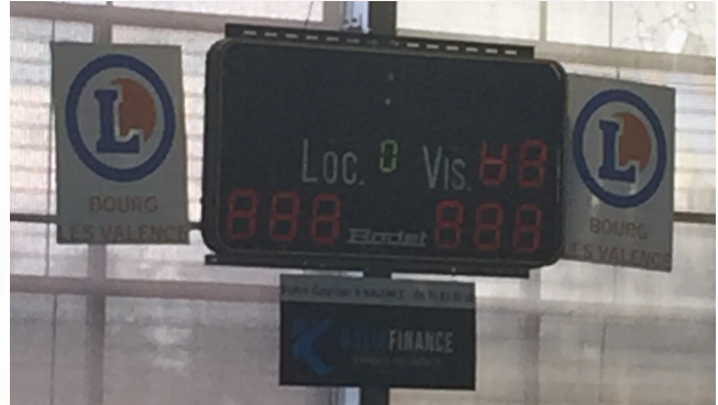
Quand Élodie Labreux fait un reset sur la table de marque