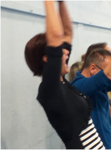
Une maman contente quand son équipe marque