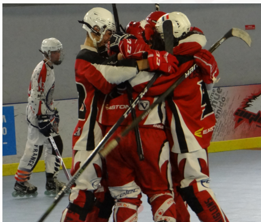
U20 - Phase1 2019-2020

Une belle journée malgré tout où les Aiglons auront su évincer un adversaire direct et se placent pour atteindre leur objectif. Reste malgré tout à continuer de travailler pour gagner cette place qualificative tant convoitée.