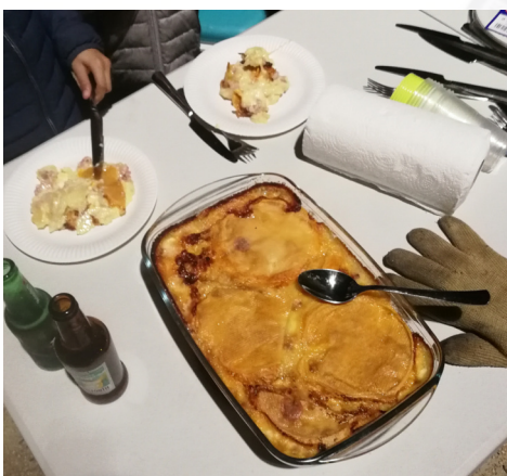
La saison hivernale des casse-croûte de la région est lancée !