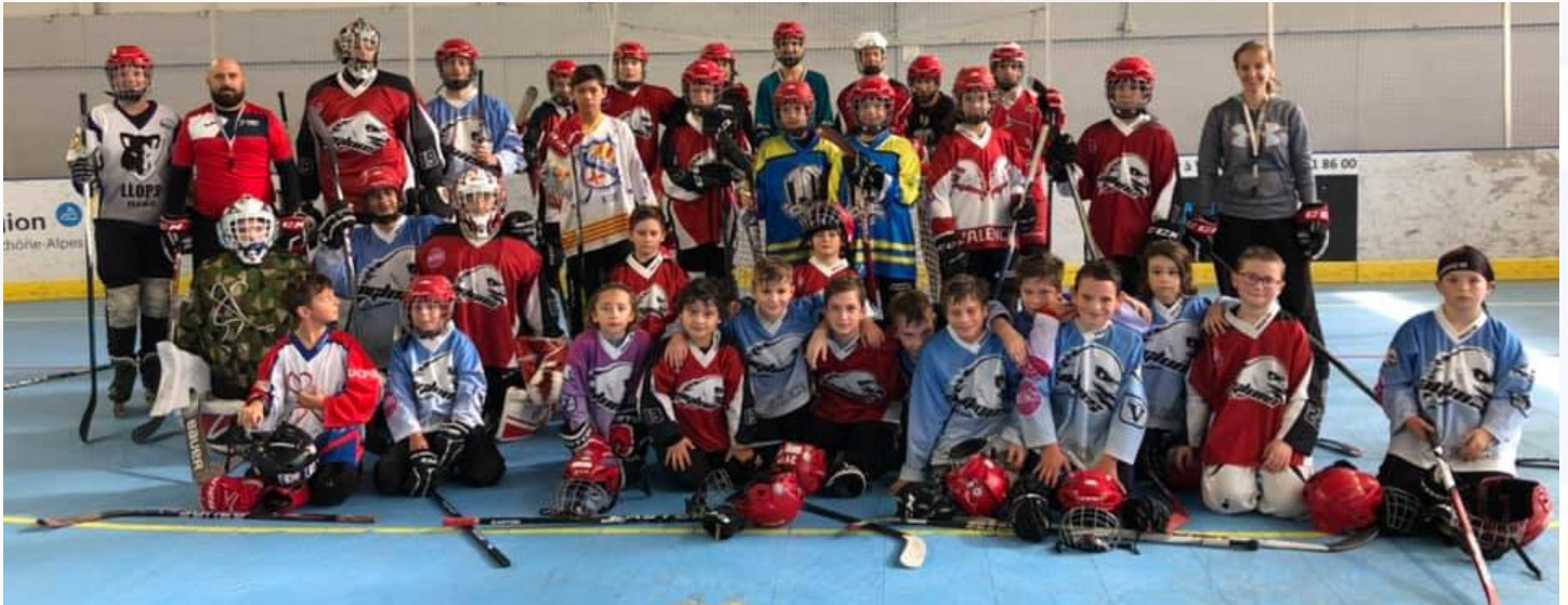
U11 à U17 durant le stage de Toussaint