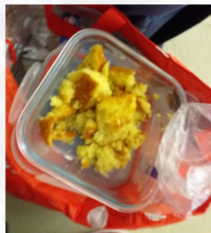
Quand une maman U17 a du mal à démouler le gâteau...