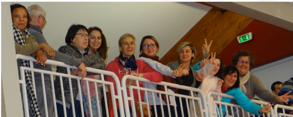
Le kop aiglons U17