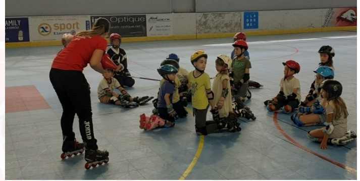
Cours improvisé durant les portes ouvertes