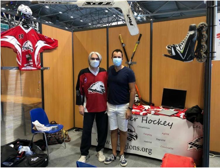
La team VRP au forum