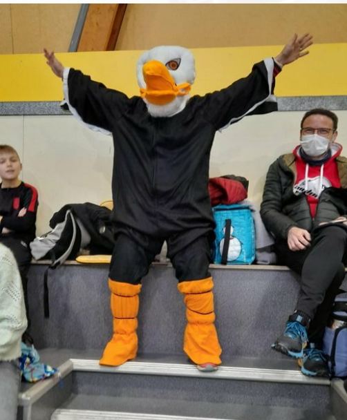
Bec et ongles