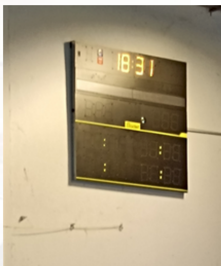
Nouvelle table de marque. Merci la ville de Valence !