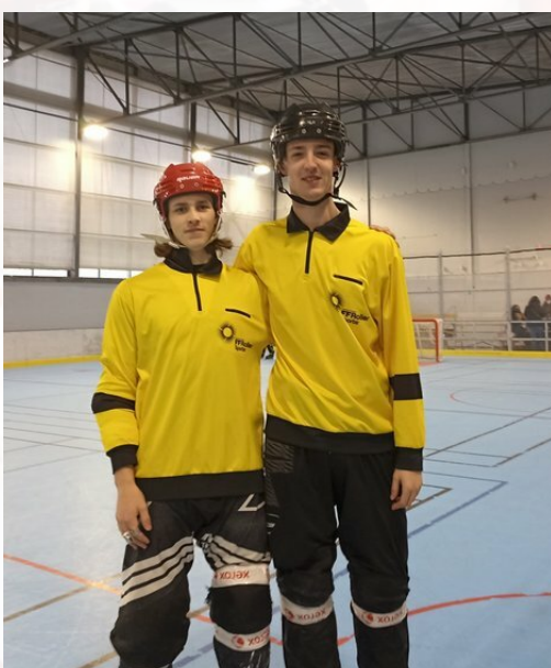
Arbitres du jour