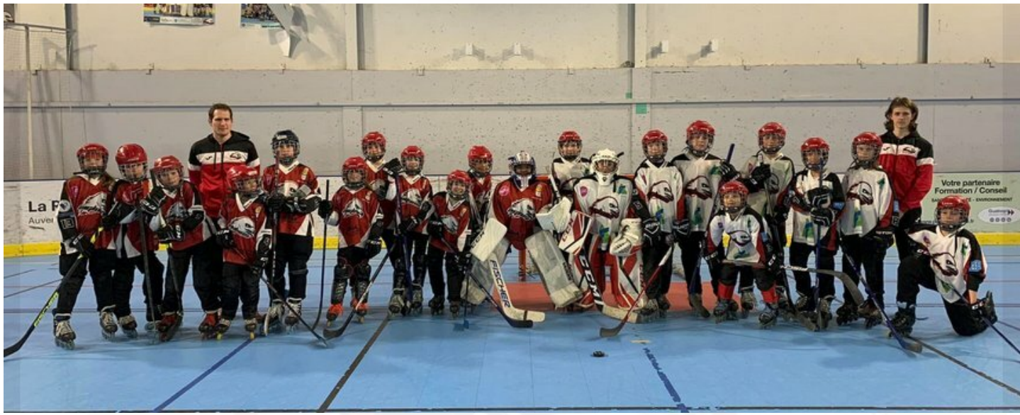
Match de gala U11/U13 en ouverture de la N2