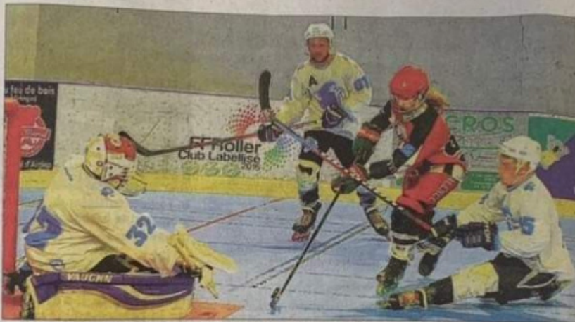
Les Aiglons ont largement dominé leurs adversaires

Les Aiglons ont inscrit deux nouveaux buts en moins de 30 secondes par Alexandre Pereira et Da-